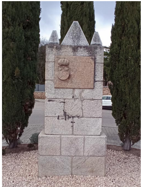
Monolito en la glorieta de Ruiz-Giménez, Hoyo de Manzanares

En 1953 el Ayuntamiento de Hoyo de Manzanares decide nombrar a Joaquín Ruiz-Giménez Cortés Hijo predilecto, Alcalde honorario y concederle la Medalla de Oro. Esta medalla había sido creada en esa misma sesión plenaria y llevaba en el anverso la Virgen de Hoyo y en el reverso el Escudo Nacional. El acuerdo del acta de Pleno del 20 de junio de 1953 dice lo siguiente: «Que dados los relevantes méritos que concurren en el Hijo de este pueblo, Excmo. Sr. D. Joa-