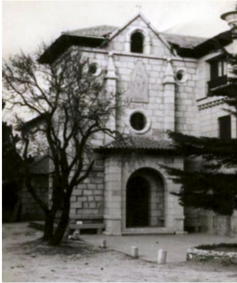
Capilla del Hostal La Berzosa

de distintas provincias de España pero, curiosamente, de las ocho o nueve mujeres empleadas, seis eran vascas. El guarda era gallego y el jardinero maño.