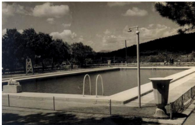
Piscina del Hostal La Berzosa