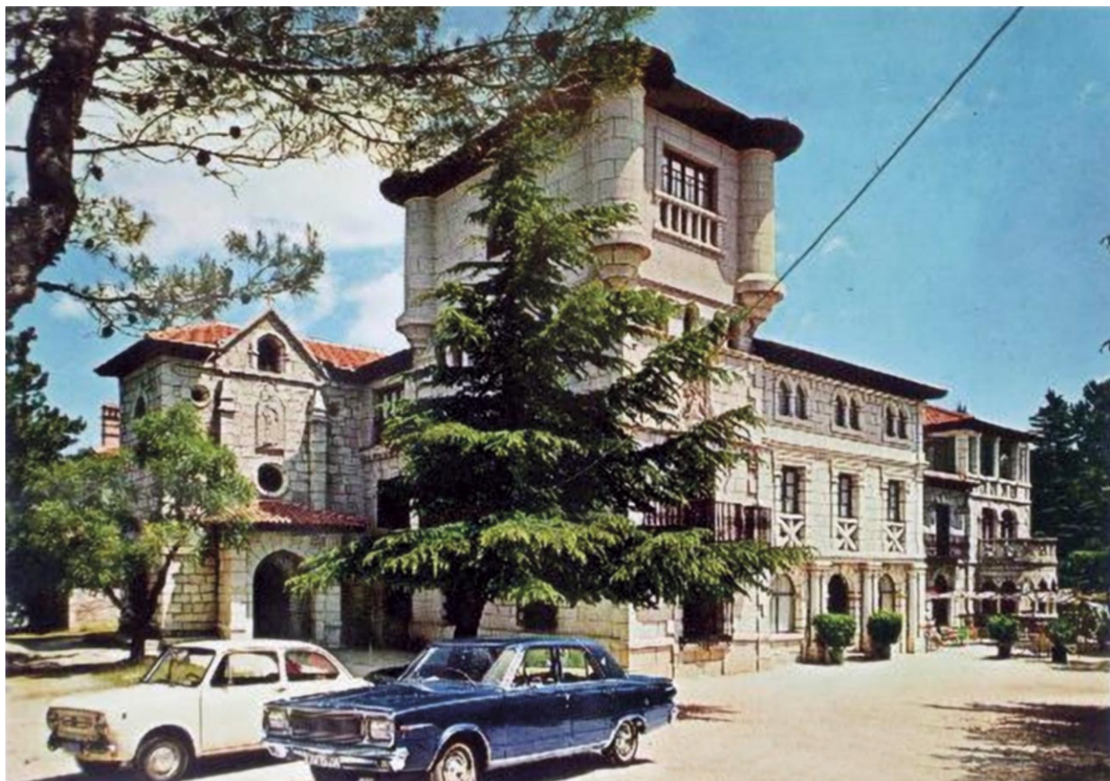
Postal del edificio del Hostal La Berzosa, años sesenta

Hoyo de Manzanares queda en zona republicana; tiene cerca los frentes de Guadarrama, Las Rozas y Brunete, y está en la ruta de evacuación de los heridos (Torrelodones-Hoyo de Manzanares-Colmenar Viejo- Fuencarral). Sin embargo, son los sanatorios antituberculosos del municipio los que se emplearán principalmente como hospital, mientras que en la casa Ruiz Jiménez se instalan los servicios de jefatura, enfermería médico quirúrgica y farmacia. No obstante, el ejército republicano organiza allí un hospital de campaña para ofensivas concretas, como la de enero de 1939 donde